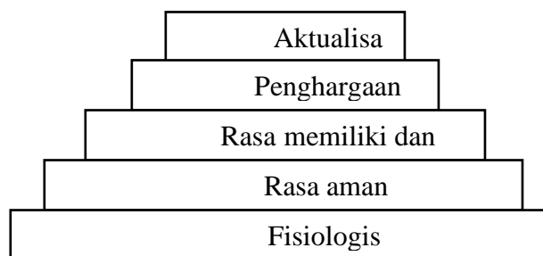
Gambar 2.3 : Hirarkhi Kebutuhan Menurut Maslow

Hipotesis Maslow menyebutkan pada setiap manusia ada lima hirarkhi kebutuhan dapat dilihat pada gambar berikut :